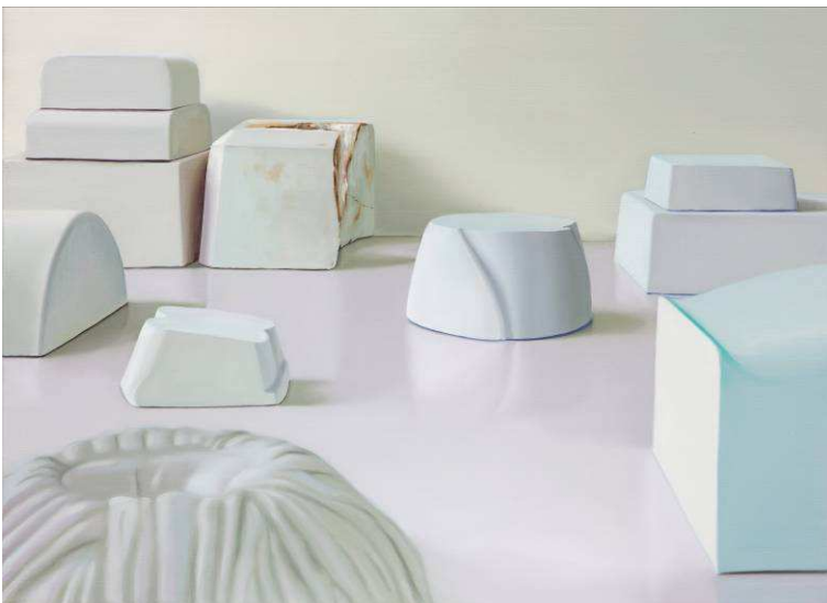
Profils , 2013, huile sur toile, 52 x 72 cm.