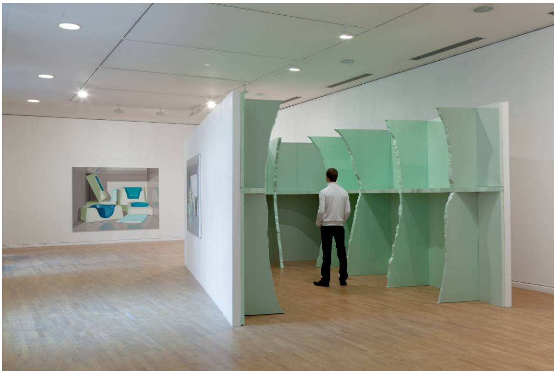
Vue de l'exposition Rêver d'abîme, élever le doute , 2012, Artothèque de Caen.