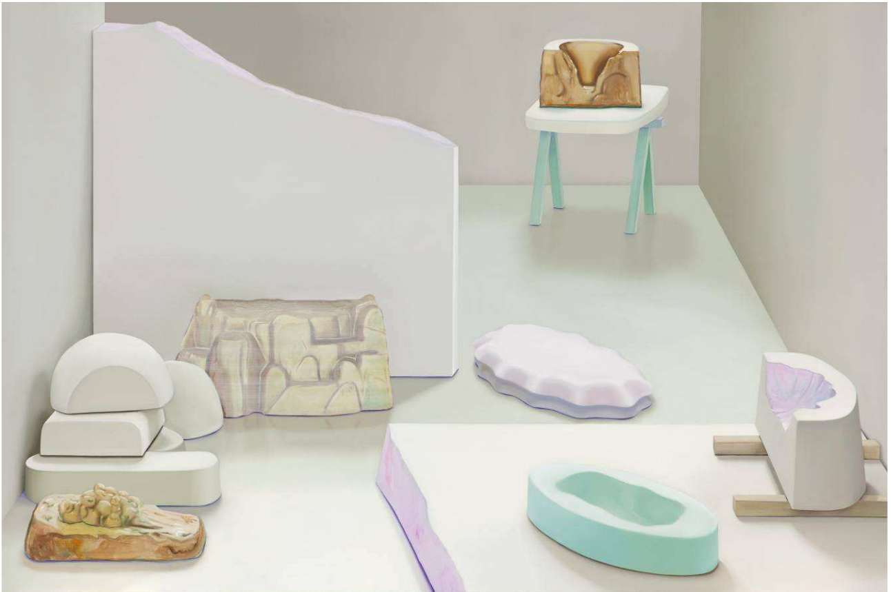
Douceurs , 2013, huile sur toile, 130 x 195 cm.