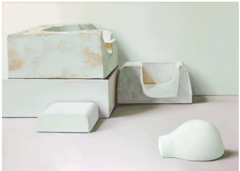
Dans l'ombre , 2013, huile sur toile, 52 x 72 cm.