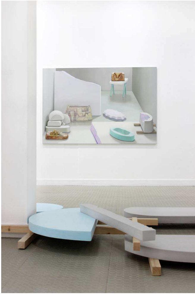
Vue de l'exposition des « Lauréats de Novembre » à Vitry, 2013 Galerie municipale, Vitry-sur-Seine.