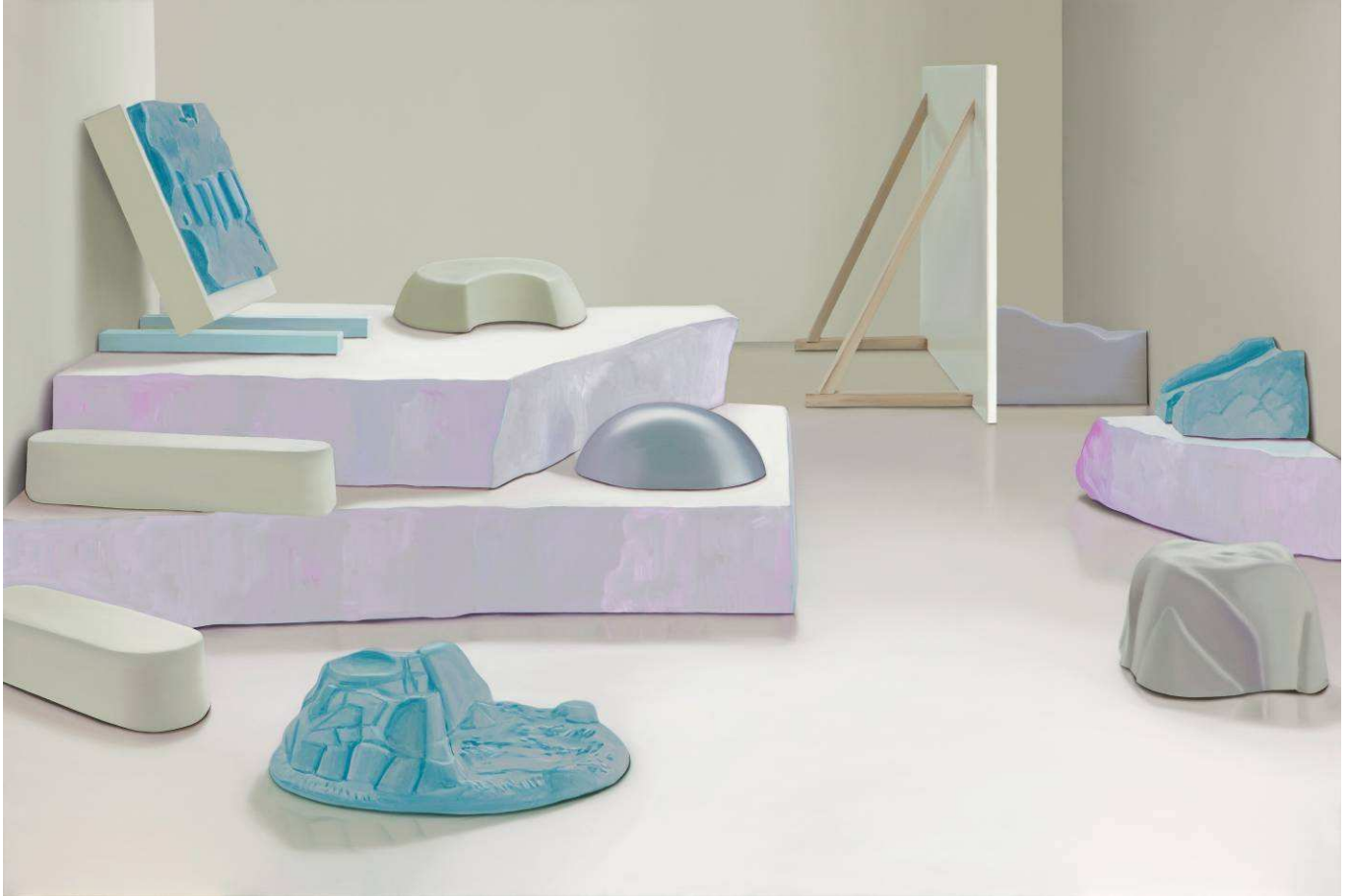
Podium , 2013, huile sur toile, 130 x 195 cm.