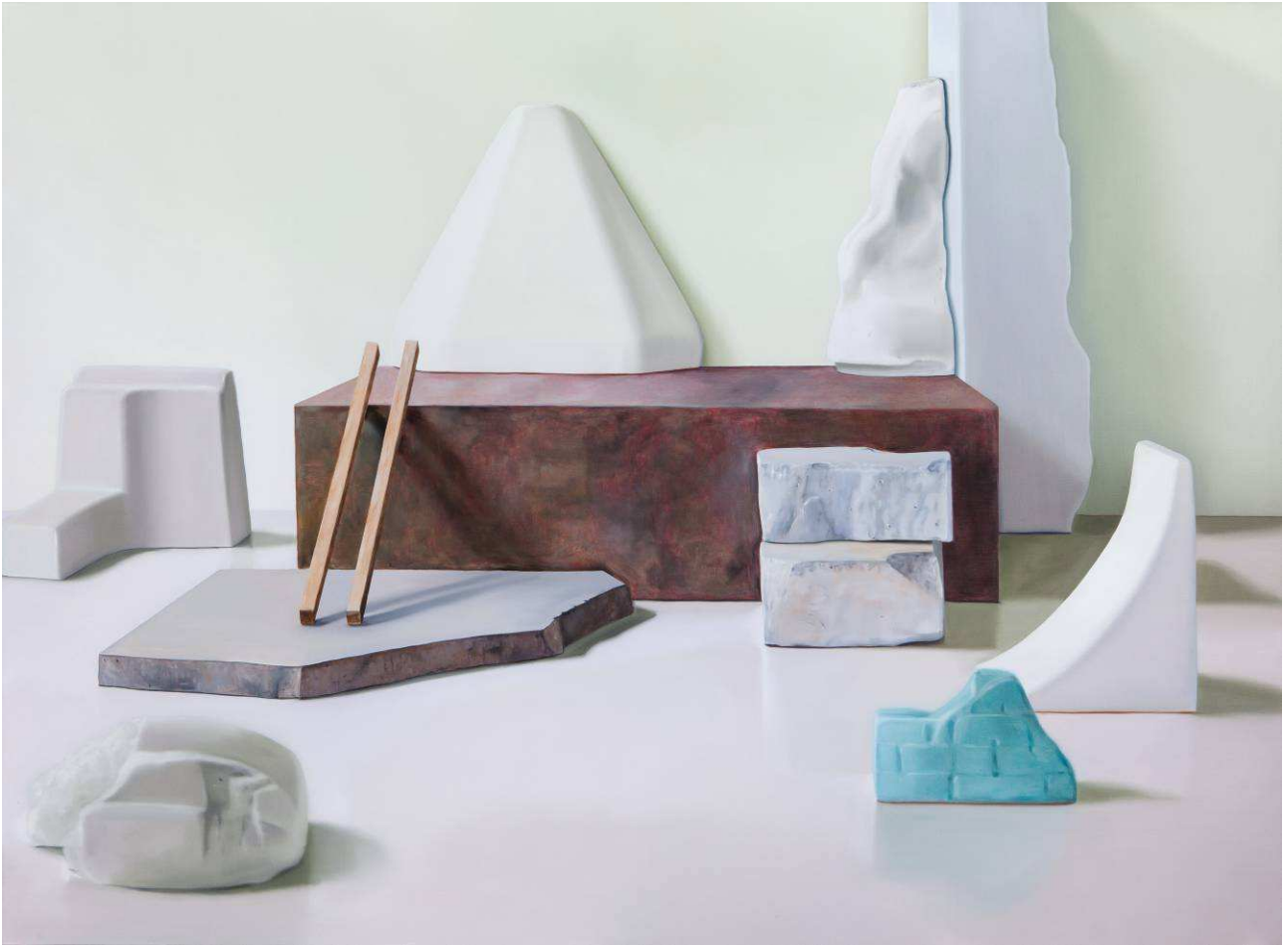
À l'appui , 2013, huile sur toile, 185 x 250 cm.